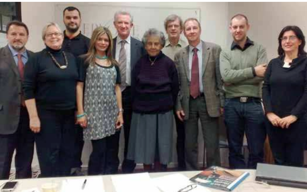
Kampf für Meinungs- und Informationsfreiheit: die Mitglieder des IFLA-Komitees »Freedom of Access to Information and Freedom of Expression«

Internet-accessible information resources from a global perspective?» von FAIFE gefördert ( http://archive.ifla.org/faife/report/StuartHamiltonPhD.pdf ).