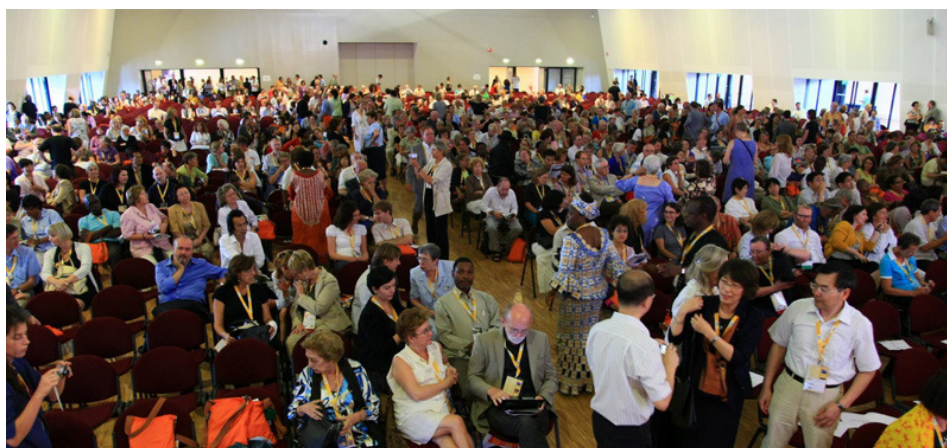
Abschlussveranstaltung am 27. August 2009