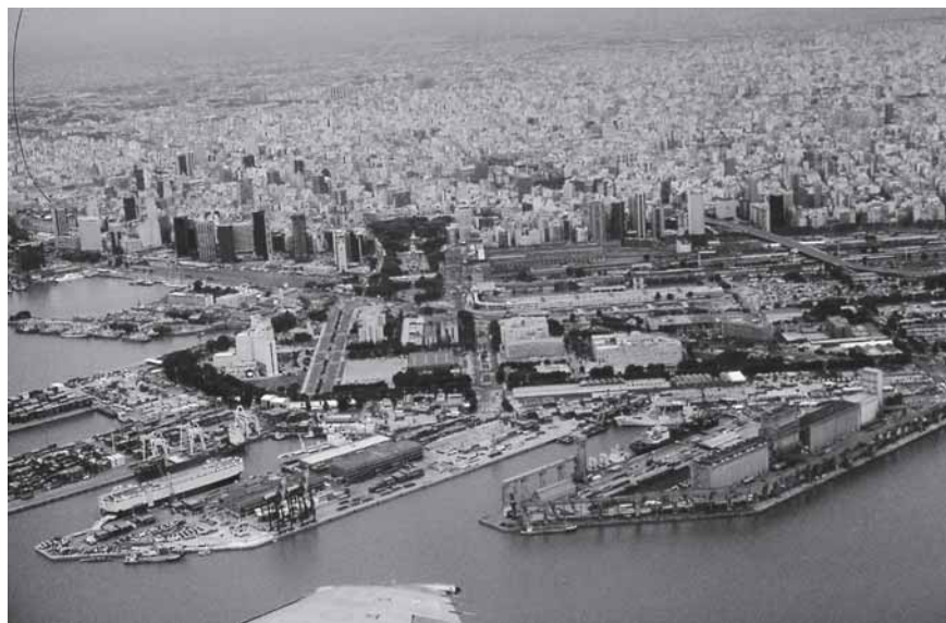
Die Metropole Buenos Aires ist über 200 Quadratkilometer groß und zählt rund elf Millionen Einwohner, das ist fast ein Drittel der gesamten argentinischen Bevölkerung.