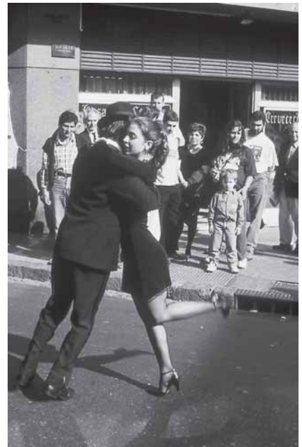
Tango: Im Stadtviertel San Telmo von Buenos Aires wird er für Touristen und Einheimische noch auf der Straße getanzt.

Vor zwei Jahren brachte das BII eigens Informationsbroschüren in englischer und spanischer Sprache heraus, um die bestehenden Kontakte zu verstärken. Unterstützt wird BII bei seinen Bemühungen in großem Maße von den Goethe-Instituten in den jeweiligen lateinamerikanischen Ländern. Besonders engagiert ist dabei das Goethe-Institut in Buenos Aires. Es ermöglicht zum Beispiel lateinamerikanischen Wissenschaftlern, über die internationale Fernleihe wissenschaftliche Aufsätze aus Deutschland zu bestellen. Außerdem ist im Internetangebot des Goethe-Instituts eine deutsch-argentinische Kooperationsseite ( www.goethe.de/hs/buelspibar.htm ) zu finden,