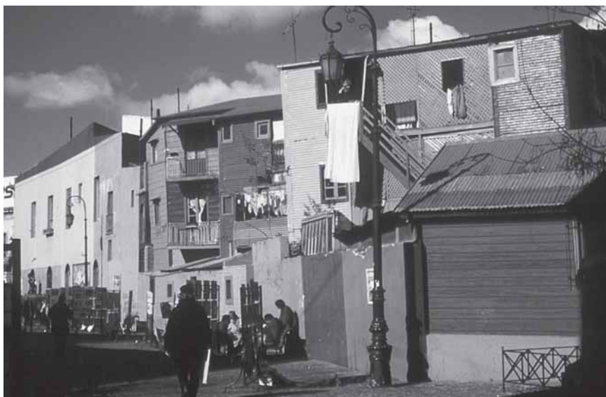
Das Hafenviertel La Boca in Buenos Aires ist weltbekannt für seine bunten Häuser.

Mit einer Auftaktveranstaltung im August 2000 in Köln wurde die Grundlage für ein kleines, aber feines Netzwerk von Bibliothekaren gelegt, die sich für die Zusammenarbeit zwischen Deutschland und Lateinamerika interessieren und einsetzen.