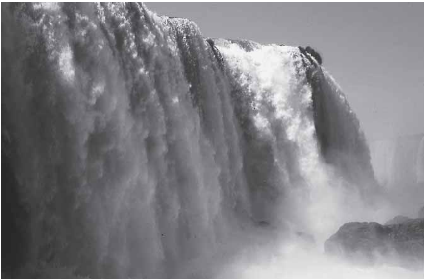
Imposant: Die Iguazú-Wasserfälle an der Grenze zu Brasilien stürzen über 70 Meter in die Tiefe.

bibliothek (siehe Beitrag auf Seite 485). Eingebunden sind aber auch einige der rund 2 000 Öffentlichen Bibliotheken, die es in Argentinien gibt, sowie die »Fundación El Libro«, eine Stiftung, die unter anderem die Buchmesse in Buenos Aires (siehe Kasten auf Seite 479) auf die Beine stellt.