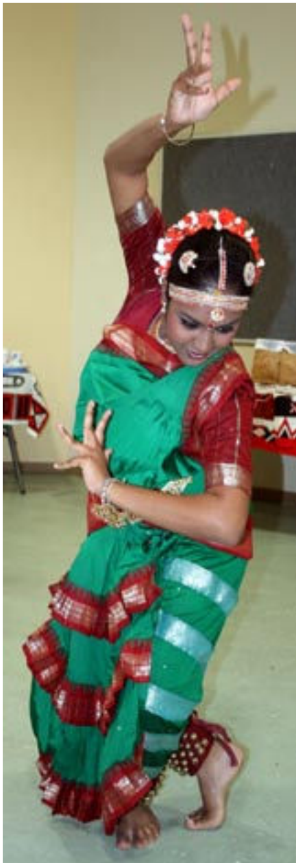
Indischer Tanz beim IFLA-Weltkongress in Südafrika: Ein Drittel der Einwohner Durbars sind Inder oder haben indische Wurzeln.

Freedom of Expression« (FAIFE), »Copyright and other Legal Matters« (CLM) sowie die Fortführung der Aktivitäten im Rahmen des Weltinformationsgipfels (WISIS), konzentriert. Gemeinsam mit der Millionen-Spende aus USA und der engagierten deutschen Präsidenten ist das eine gute Ausgangsposition, um das Bewusstsein für die Bedeutung der Bibliotheken bei der Entwicklung der Informationsgesellschaft zu fördern. Inwieweit das gelungen ist, kann schon der nächste IFLA-Weltkongress zeigen. Er findet vom 10. bis zum 15. August 2008 im kanadischen Québec statt.