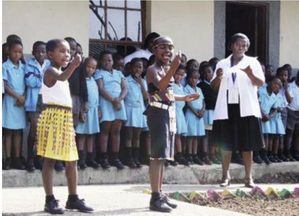
Gedichte und Lieder präsentierten die Schüler der Saphumelela School den internationalen Kongressteilnehmern in einer Vorstadt Durban's.

Ein zentraler Punkt der internen IFLA-Reform war die jüngste Umstellung der IFLA-Strategie auf das sogenannte Dreisäulen-Modell: Mitglieder – Facharbeit – Gesellschaft. In diesem Strategiepapier