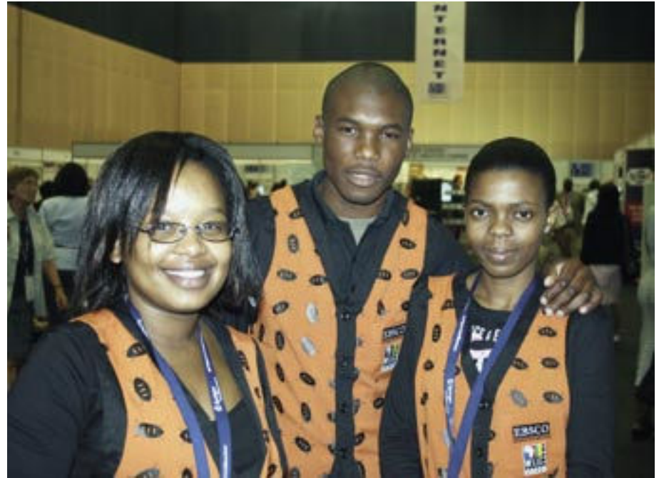
Die Großveranstaltung war perfekt organisiert: Ein Heer von freiwilligen Hilfskräften stand den Teilnehmern freundlich zur Seite.

Der IFLA-Weltkongress in Südafrika wäre eine hervorragende Gelegenheit gewesen, die Aids-Katastrophe, gegen die Einzelkämpfer in Bibliotheken auf verlorenem Posten stehen, auf die politische Tagesordnung zu heben. Nach Angaben von UNAIDS, des Joint United Nations Programme on HIV/Aids, sind in Schwarzafrika 38,6 Millionen Menschen mit HIV infiziert. Von den 3 100 Kongressteilnehmern stammte rund die Hälfte aus afrika-