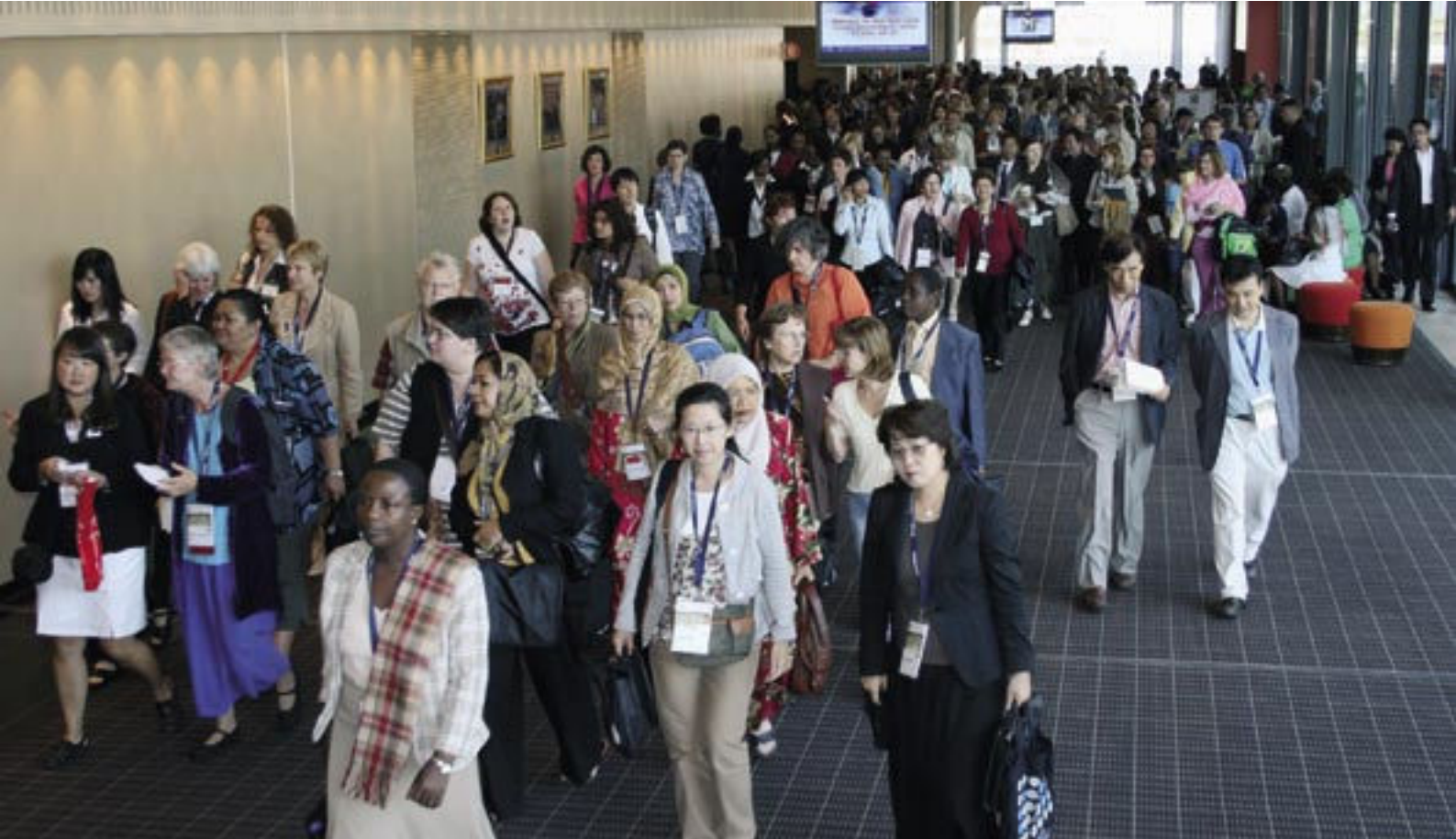
3 100 Bibliothekare und Informationsspezialisten aus mehr als 120 Ländern – darunter 50 aus Deutschland – kamen zum diesjährigen IFLA-Weltkongress nach Südafrika.