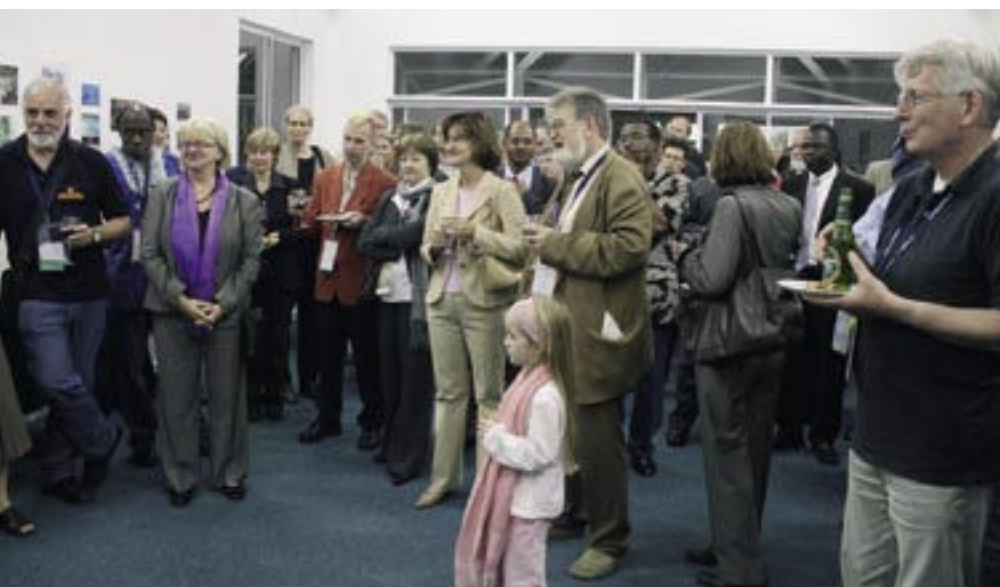
Entspannung nach einem langen Kongresstag: die deutschen Teilnehmer beim Empfang in der Deutschen Schule Durban

Zumindest in Südafrika hat man mit der Rückeroberung der eigenen Kultur und Geschichte begonnen. In der Eröffnungsfeier des Kongresses kündigte der südafrikanische Minister für Kunst und Kultur, Pallo Jordan an, dass die Regierung in den kommenden drei Jahren eine Milliarde Rand, das sind umgerechnet 100 Millionen Euro, in den Ausbau der Bibliotheken stecken wird. Der Minister sagte: »Wir brauchen eine bessere Ausbildung der Mitarbeiter, längere Öffnungszeiten, moderne Informationstechnologie, Bücher und Medien in der Muttersprache