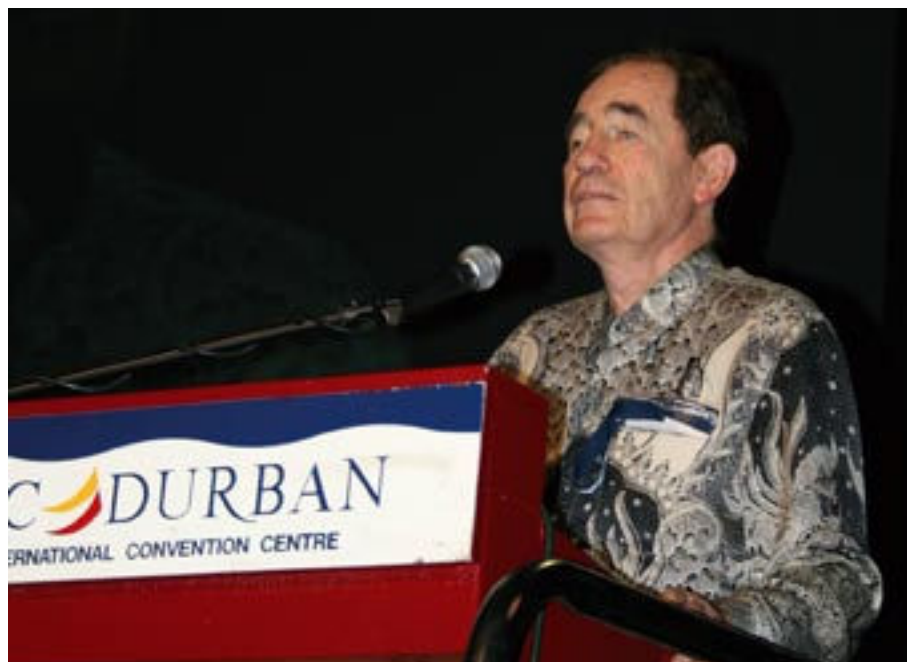
Bewegende Rede: Der Richter am südafrikanischen Verfassungsgericht, Albie Sachs, berichtete über seine Erfahrungen im Gefängnis während der Apartheid.