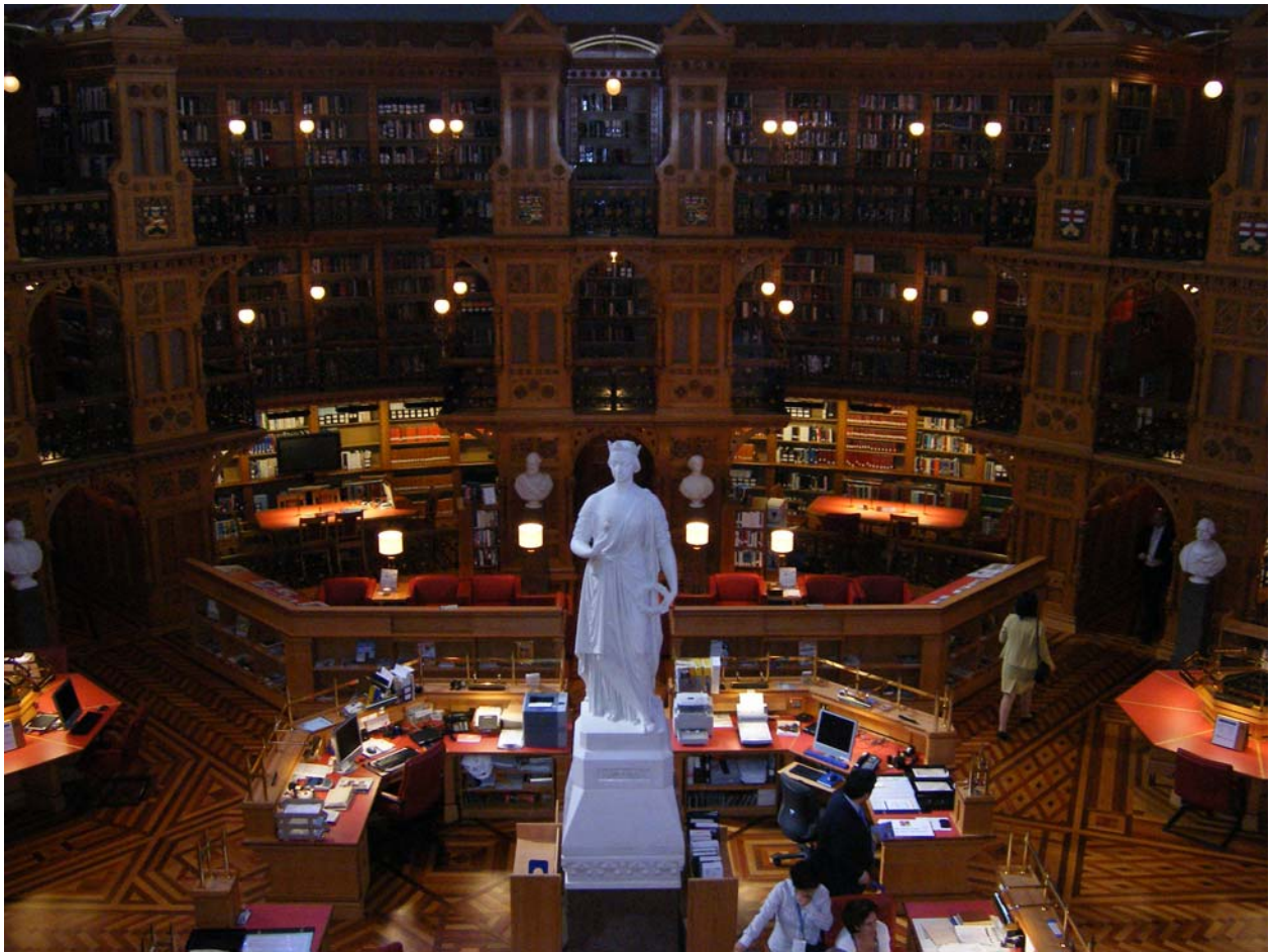
Der Lesesaal der kanadischen Parlamentsbibliothek nach der Restaurierung mit Blick auf die Infothek, die sich um die Statue der Königin Viktoria gruppiert und im Hintergrund der Blick auf die Sitzecke im Zeitschriftenbereich